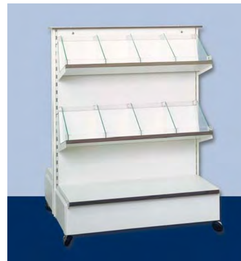
MOD. G21 - G22 FRONTE C per quaderni o party