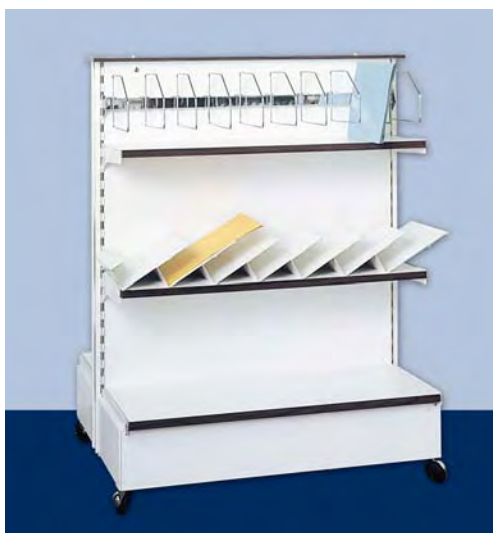
MOD. G21 G22 FRONTE D per cartelle e buste