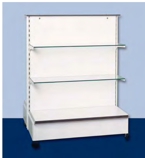
MOD. G21 - G22 FRONTE B per articoli vari o per vetrina