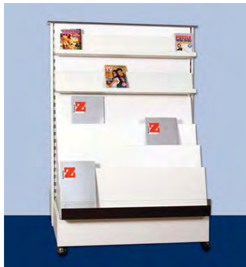
MOD. G21 – G22 FRONTE T per riviste, fumetti, enigmistiche