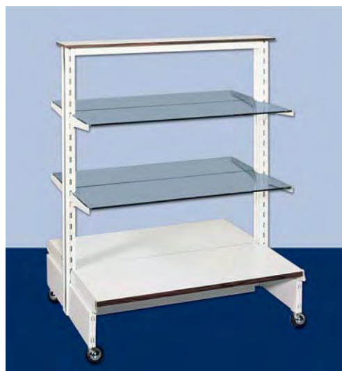
MOD. G23 – G23A per articoli vari o per vetrina