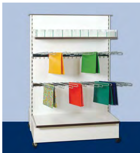
MOD. G21 - G22 FRONTE M per carta regalo, fiocchi, nastri, ecc.