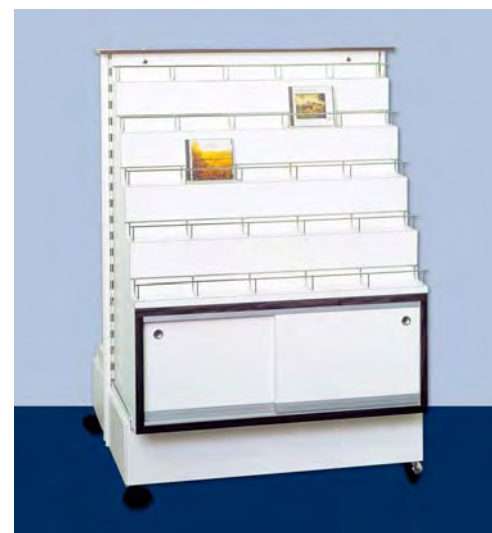
MOD. G21 - G22 FRONTE N per dischi, compact e musicassette