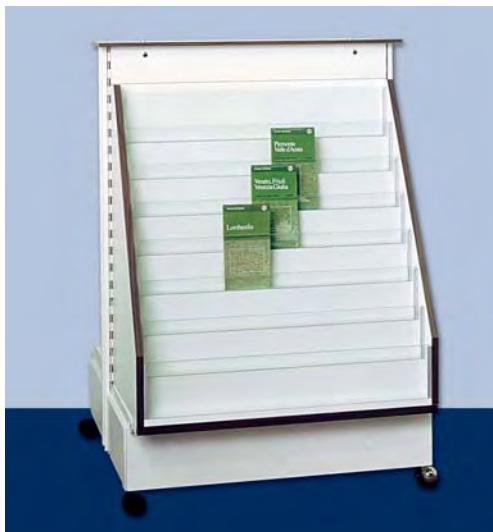
MOD. G21 – G22 FRONTE S per carte stradali e guide