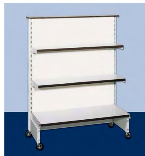
MOD. G24 mezza gondola