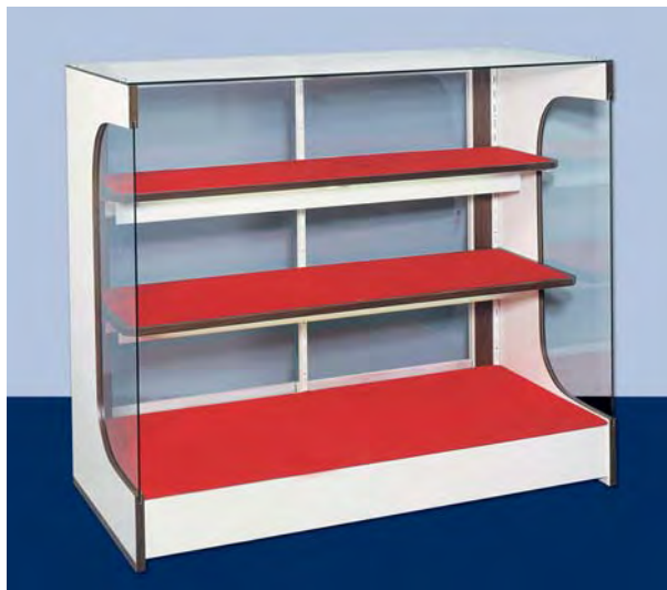
MOD. V43 vetrina esposizione