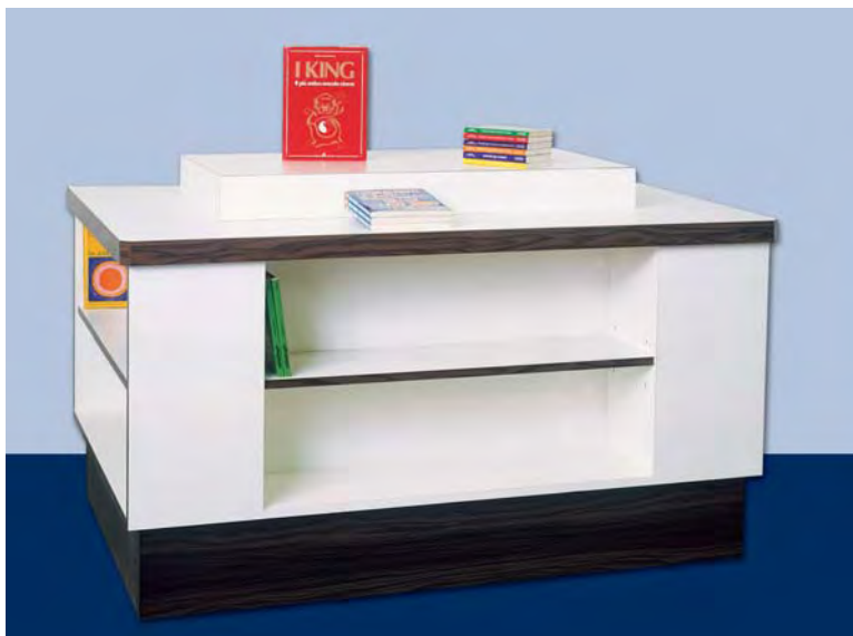
MOD. G26 isola libri