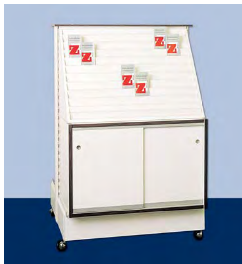
MOD. G22 FRONTE H per biglietti augurali