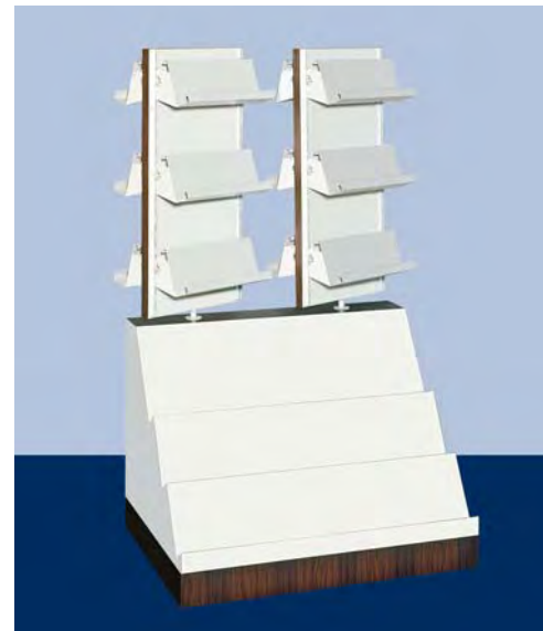
MOD. V56 vetrina esposizione libri