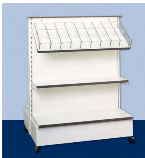
MOD. G21 - G22 FRONTE E per cancelleria ufficio