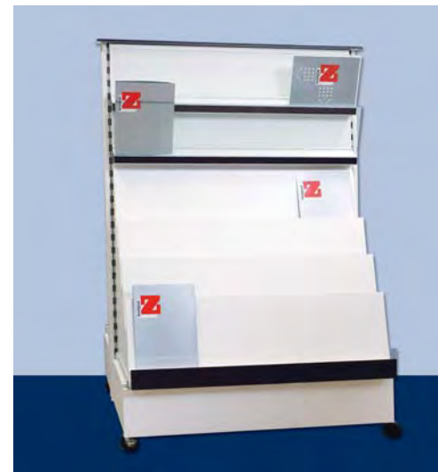
MOD. G21 – G22 FRONTE U per riviste e periodici in genere