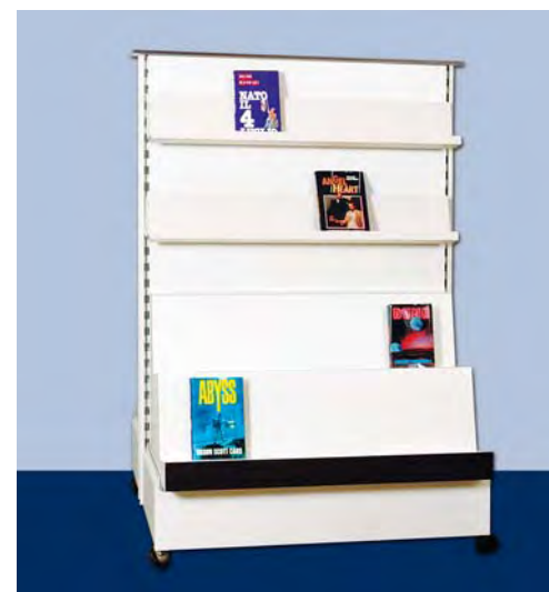
MOD. G21 - G22 FRONTE F per libri - album da colorare - fumetti