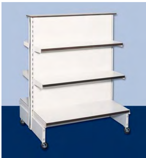
MOD. G21 - G22 FRONTE A per articoli vari

VEDERE CARATTERISTICHE A PAGINA 80 - 81 - 82