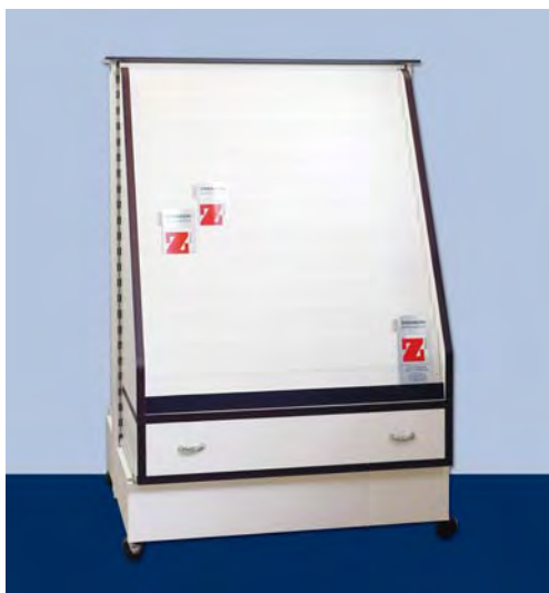
MOD. G22 FRONTE G per biglietti augurali