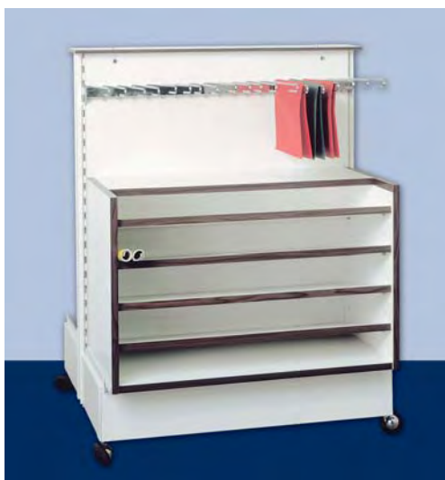
MOD. G21 - G22 FRONTE L per carta regalo in rotoli e piegata