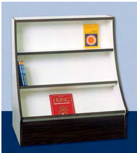
MOD. G25 isola libri