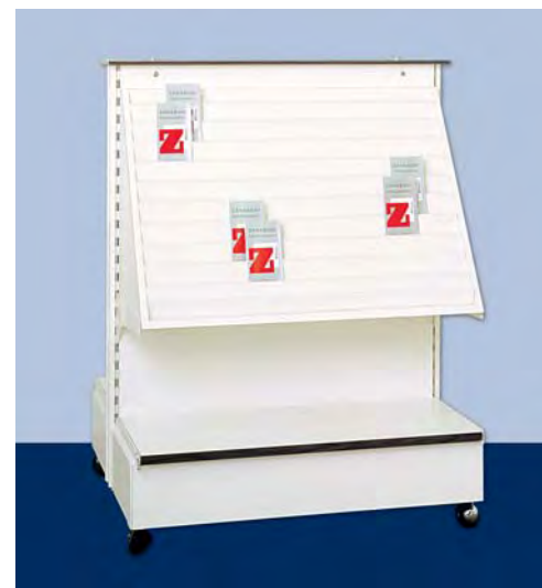
MOD. G21 - G22 FRONTE I per biglietti augurali