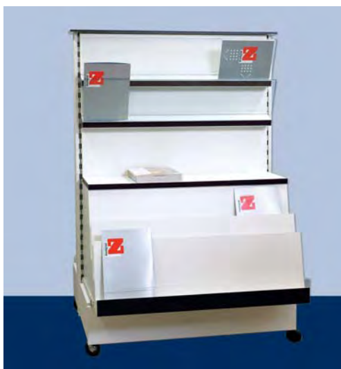
MOD. G21 – G22 FRONTE Z per riviste e periodici in genere